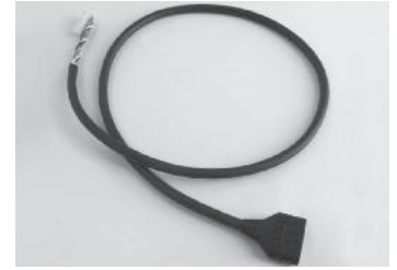
延長ケーブル・全体