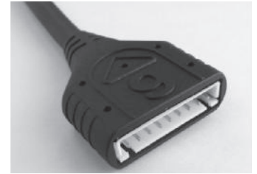
コネクタ部(9Pタイプ)