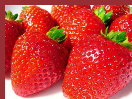
兵庫県オリジナル品種も ビニールハウスで栽培中！