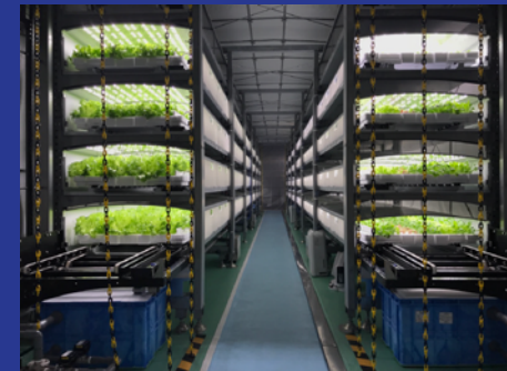
最新 植物工場レタス