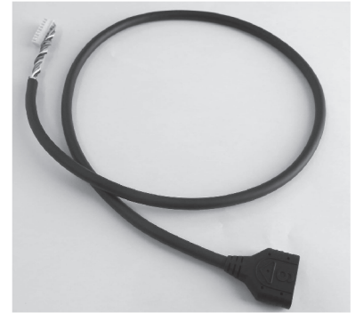
延長ケーブル・全体

ドライバ CB-016・HB-510・HBM-604・HBK608 IB-C02・IB-E03/04