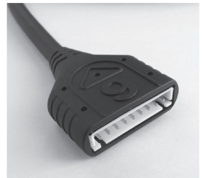
コネクタ部 (9P タイプ)